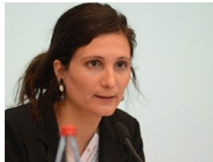
A la tribune de l'Assemblée des Français de l'étranger en mars 2017

Tout au long de mon mandat, j'ai eu l'immense plaisir d'être au contact de nombreux compatriotes pour préparer des dossiers de bourses scolaires, discuter des options d'école pour leurs enfants ou encore faire remonter les préoccupations, comme par exemple le manque de réciprocité du permis de conduire. Ce mandat fut une expérience humaine très formatrice et enrichissante.